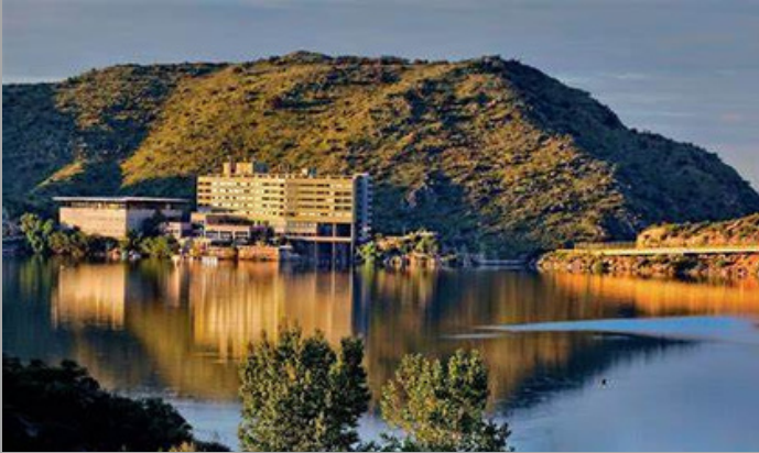
Potrero de los Funes (San Luis ,Arg)