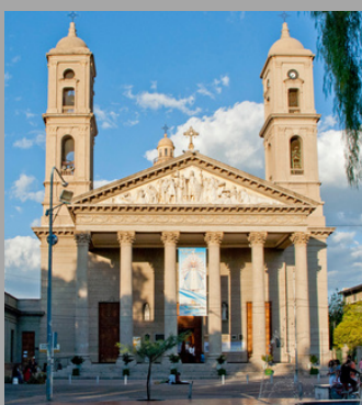
La Catedral (San Luis,Arg)