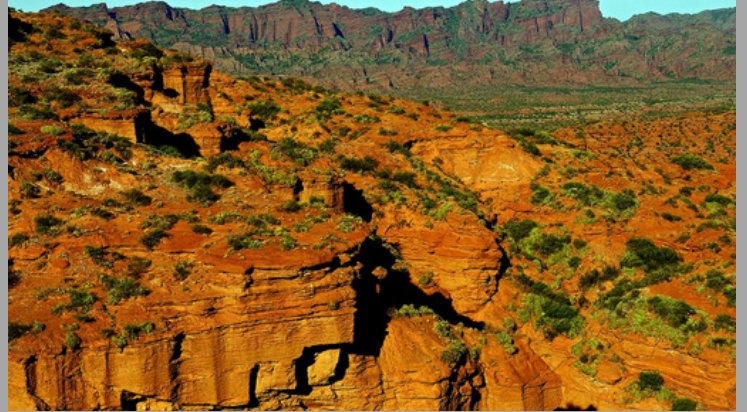
Parque Nac Sierras de las Quijadas (San Luis ,Arg)