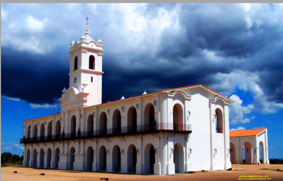
La Punta (San Luis , Arg)