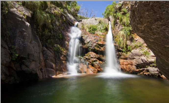
Villa Elena-Cortaderas (San Luis, Arg)