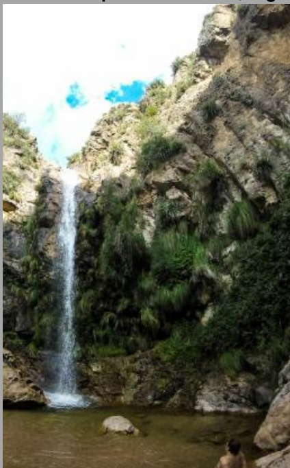
Villa Larca, Chorro San Ignacio (San Luis, Arg)