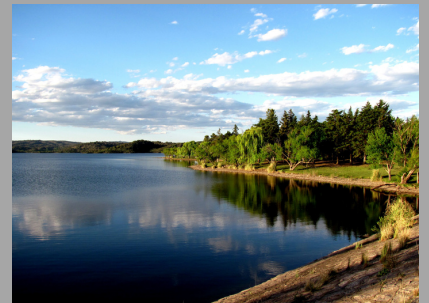
La Florida (San Luis ,Arg)